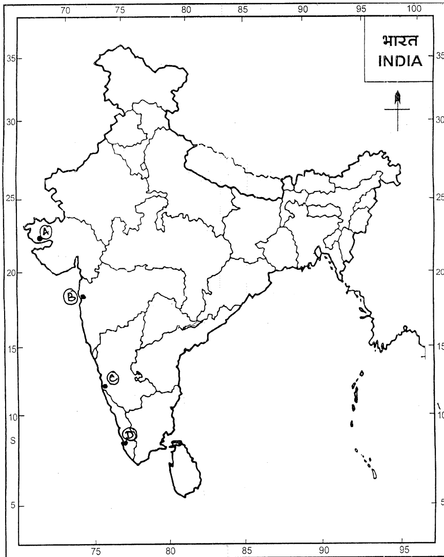
Political Map of India

Note : Following questions are for the Visually Impaired Candidates only in place of questions (28) and (29).